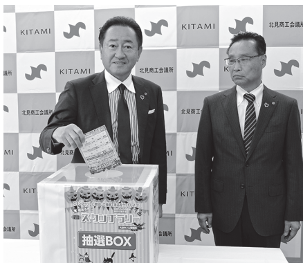
舩川会頭らによる「2025第1回街あるきスタンプラリー」の抽選会

応募は160人からあり、11月5日の抽選会により当選者が決まり、景品を発送しました。（担当 後藤達哉）