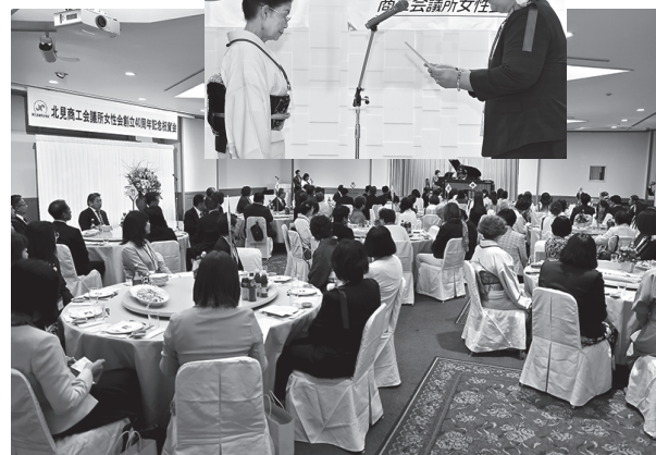
創立40周年記念式典・祝賀会

女性会 創立40周年記念事業で 節目祝い、一層の発展誓う 女性会の創立40周年記念式典が9月12日、道内10商工会議所の会員、来賓らを含め約100人の出席によりホテル黒部で行われ、節目を祝うとともに一層の発展を誓いました。 当所女性会は昭和60年に会員46人