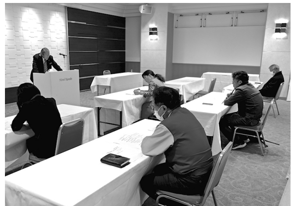
経営戦略セミナー

本 社 〒099-1587 北見市豊地69番地20(工業団地) TEL : 0157-36-3105 FAX : 0157-36-0298 帯広工場 〒080-2463 帯広市西23条北2丁目17番地20 TEL : 0155-33-8101 FAX : 0155-33-8102