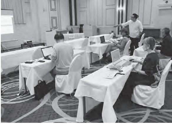
AI・ITツール活用法セミナー