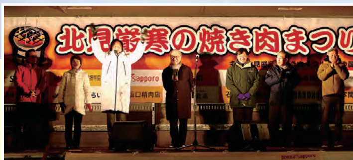
北見の冬をにぎやかに彩った「第55回北見冬まつり」(2/8・9)と「第26回2025北見厳冬の焼き肉まつり」(2/7)。市内外からの来場者が冬や食を満喫しました