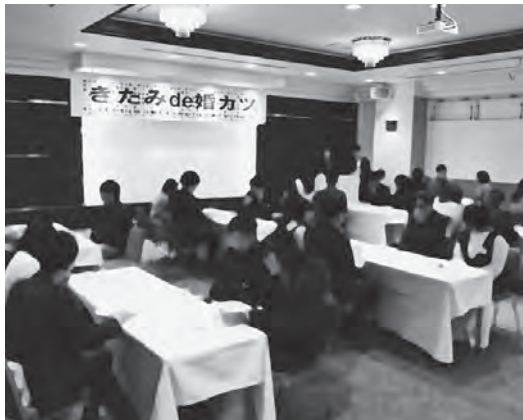
募集人数を上回る参加があった婚カツ

当所ときたみde街コン実行委員会主催の「きたみde婚カツ」が2月1日、ホテル黒部で実施され、9組のカップルが誕生しました。