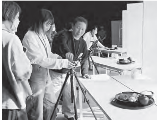
スマホ撮影セミナー

準備編として、スマホの設定(解像度の最高画質、レンズの確認)、三脚の使用、太陽光での撮影などの説明に続き、撮影編では、参加者が班に分かれて自身のスマホで太陽光の中、ランチプレート(ハンバーグ)の撮影に挑戦しました。