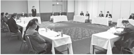
正副会頭と部会長・委員長懇談会