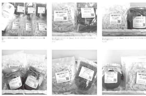
オンラインショップ画面

同店は、平成13年イタリア料理・洋食店として開店。地元産のトマトでソースを作ることにこだわり、20年から調理用トマトの栽培に着手。地元業者に栽培、1次加工を委ね、ソースを完成。製造量の拡大・安定化を図ってきました。 店舗の情報はSNSによる発信にとどまっていたが、同補助金により、目指したプランは「オホーツク産調理用トマト加工商品のネット