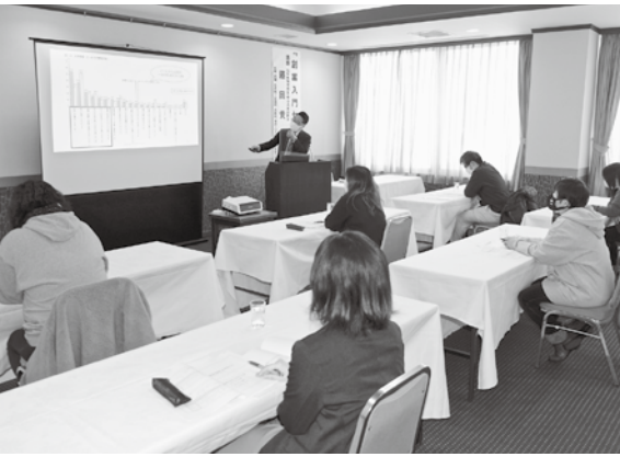
創業入門セミナー