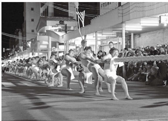
今年の屯田大綱引は東西対抗戦

北見ぼんちまつりは、新型コロナウイルス感染症が拡大する中、一昨年、昨年と2年連続の中止を余儀なくされ、実行委員会は代替事業に知恵を絞るなど対応してきました。今年には感染状況、管内他市町村の