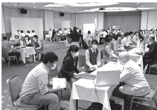
マスクをつけて説明する企業担当者と熱心に聞く高校生

企業・団体の人事担当者らは、パソコンやプロジェクト、資料などを活用しながら、自社の概要や求める人材などを説明。生徒たちは関心がある3社・団体のブースを回り、熱心に就職情報を収集していました。学校の長期休校など新型コロナウイルス感染症の影響から、来春卒業の高校生の採用選考開始が1カ月延