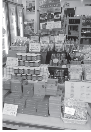
北見の商品が並んだコーナー

本年度は前年度に実績のある(株)ツムラ、(有)香遊生活ほか、新規の(有)八仙閣(やみつぎ調味料オホーツク三大醬)