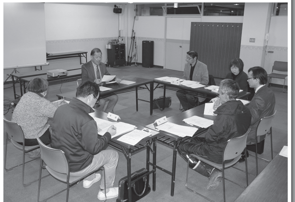
シニア向け起業セミナー