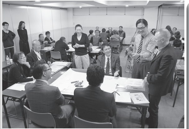
インバウンドおもてなしセミナー