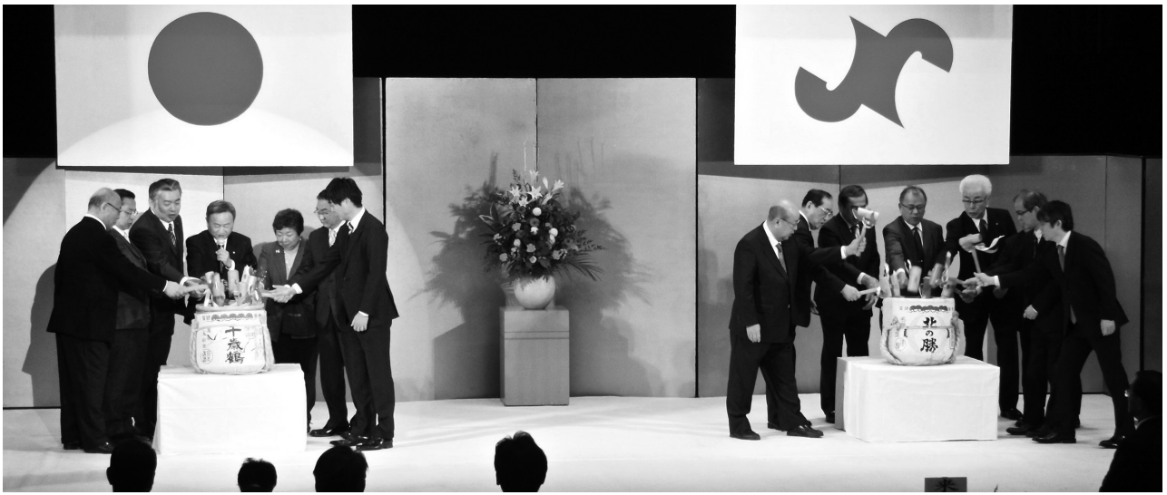
各界代表15人による鏡開き