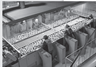
(担当 池亀 由基)

会員22人は、最新の施設概要や生産状況の説明を受け、作業員や機器による選果ラインを経て段ボール箱に入るまでの工程を間近にし、タマネギの一大産地北見を再認識していたようです。