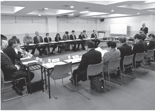
議員改選後初のサービス業部会

各部会では、役員選任のほか、事業継続力強化計画（BCP）制度の概要について、東京海上日動火災保険㈱から情報提供するとともに、事務局がクールチョイス事業（温暖化対策に資するあらゆる「賢い選択」を促す国民運動）に関連し、本年度取り組んでいる「エコドライブ」の推進について、それぞれ説明しました。