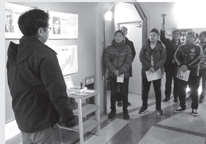
(担当 武田 卓)

このあと、参加者は、北見ピアソンホテル瀋陽飯店で、北見の食を味わいながら同ツアーの振り返りとともに、北見の魅力について意見交換しました。