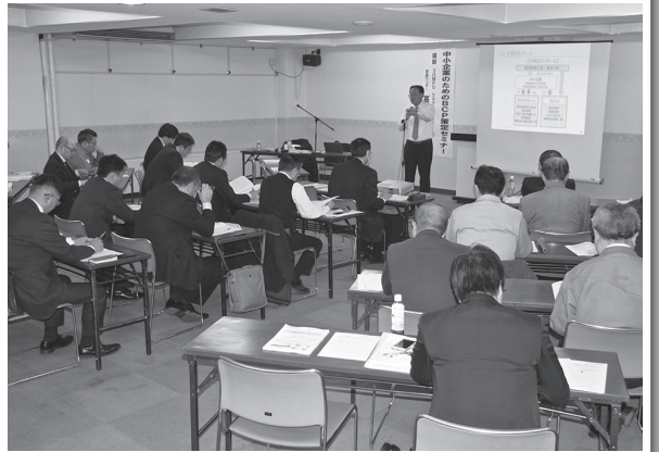
中小企業のためのBCP策定セミナー

「シニア向け起業セミナー」(11/11・12)は、当所中小企業相談所、オホーツク産学官融合センター、北見市の主催・共催により初めて企画されました。