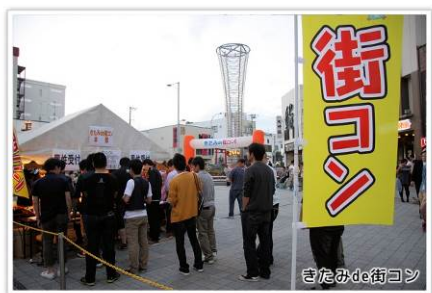
【H29.9.23 開催 男女合計 297 名により実施】

当地域の独身男女の出会いの場の提供と、中心街の賑わい、交流人口の拡大を目的に街コン事業を実施しています。