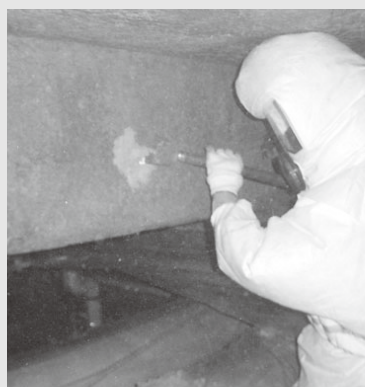
アスベスト除去工事