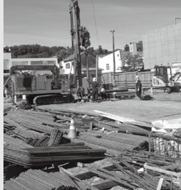
地中熱ヒートポンプ工事