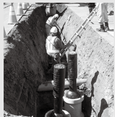
配水管布設替工事