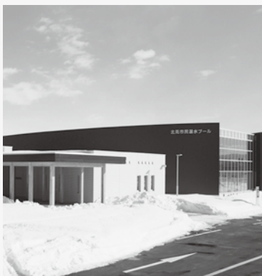
北見市民温水プール 冷暖房空調設備工事・ 地中熱ヒートポンプ工事 H27.3 完成