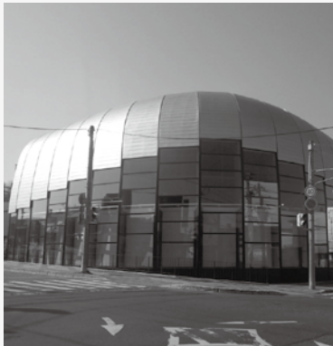
北見信用金庫紋別支店 地中熱ヒートポンプ工事 H27.4 完成