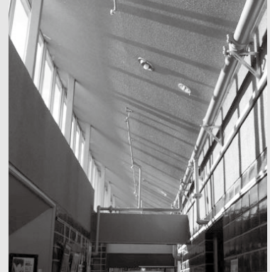
スプリンクラー設備工事