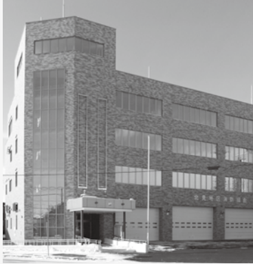
北見地区消防組合北見消防本部 地中熱ヒートポンプ工事 H28.1 完成