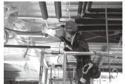
冷媒配管溶接状況(高所作業)