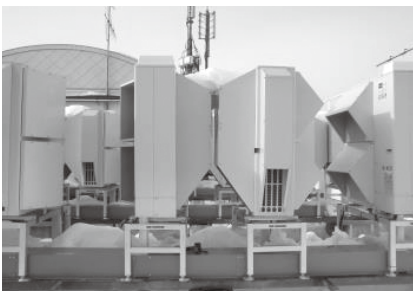
エアコン室外機(屋上設置)