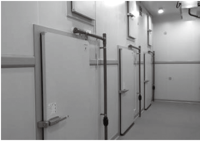
冷蔵庫内及急速冷凍庫扉