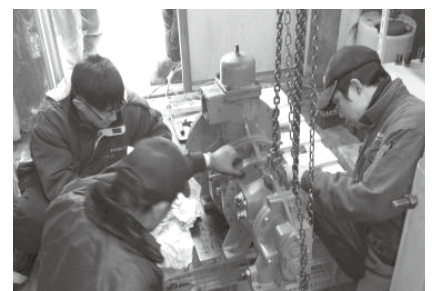
冷凍機オペ-ホール組立完了