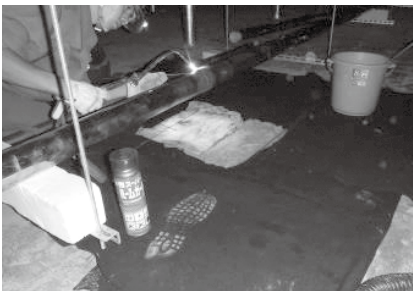
冷媒配管溶接状況(銅管)