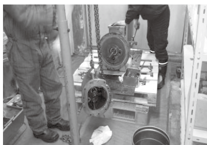
冷凍機オペ-ホール状況