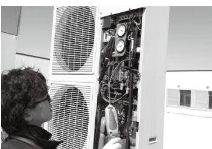
フロンガス漏れ点検状況